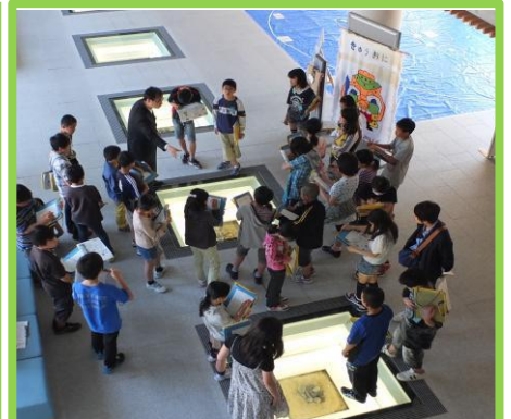
遺構展示、文化財修復・整理見学