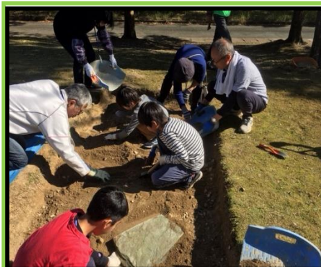
古代体験(上:発掘体験 下:拓本体験)