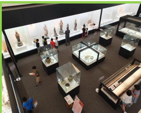
展示見学(常設展)(企画展・特別展)

※学校の規模(参加人数)等によっては、希望する学習プログラムの実施が難しい場合もあります。