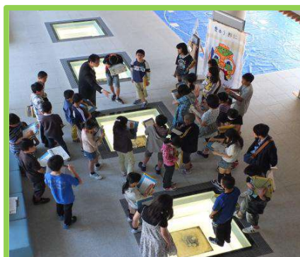
遺構展示、文化財修復・整理見学