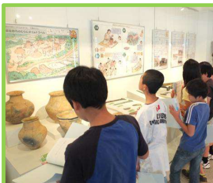
企画展「きゅうおにとタイムトラベル」