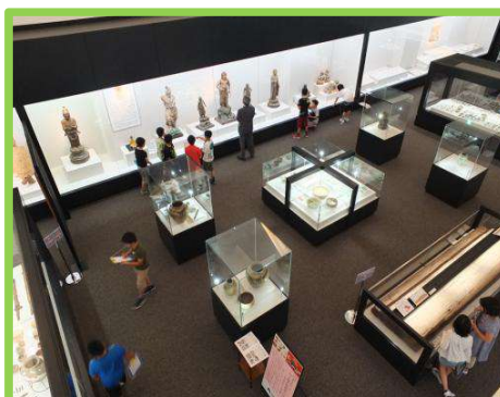
展示見学（常設展）（企画展・特別展）

※学校の規模(参加人数)等によっては、希望する学習プログラムの実施が難しい場合もあります。